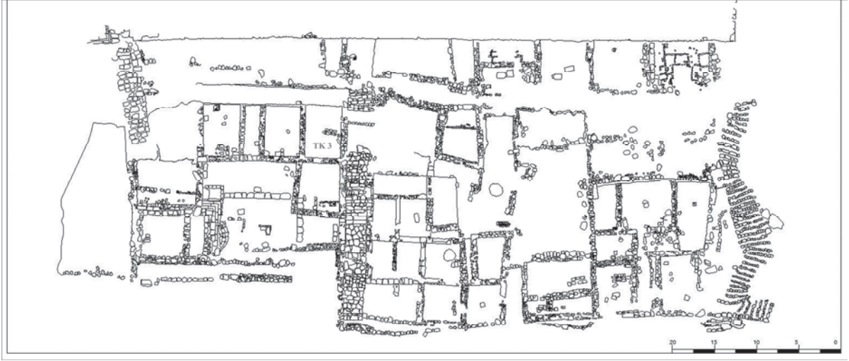
Plan 1. Büyük Bazilika'nın kuzeyindeki, Tapınak ve Tapınağın kuzeyindeki ve doğusundaki Mekanlar.