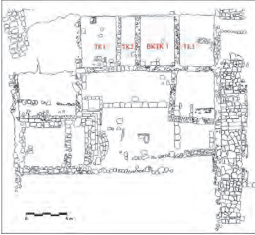
Plan 2. Podyumlu, Prostýlos-Tetrastýlos planlı tapınağın Temenosundaki TK Açmaları.