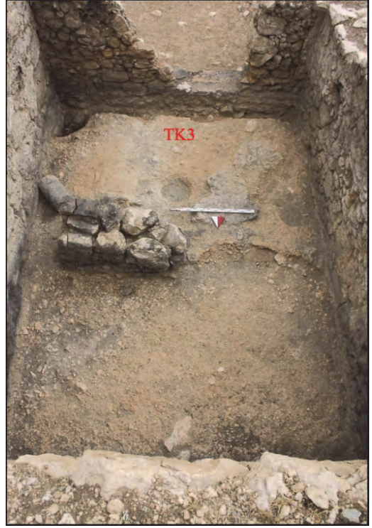
Figür 2. Definenin ele geçtiği TK3 açması (Othografik fotoğraf)